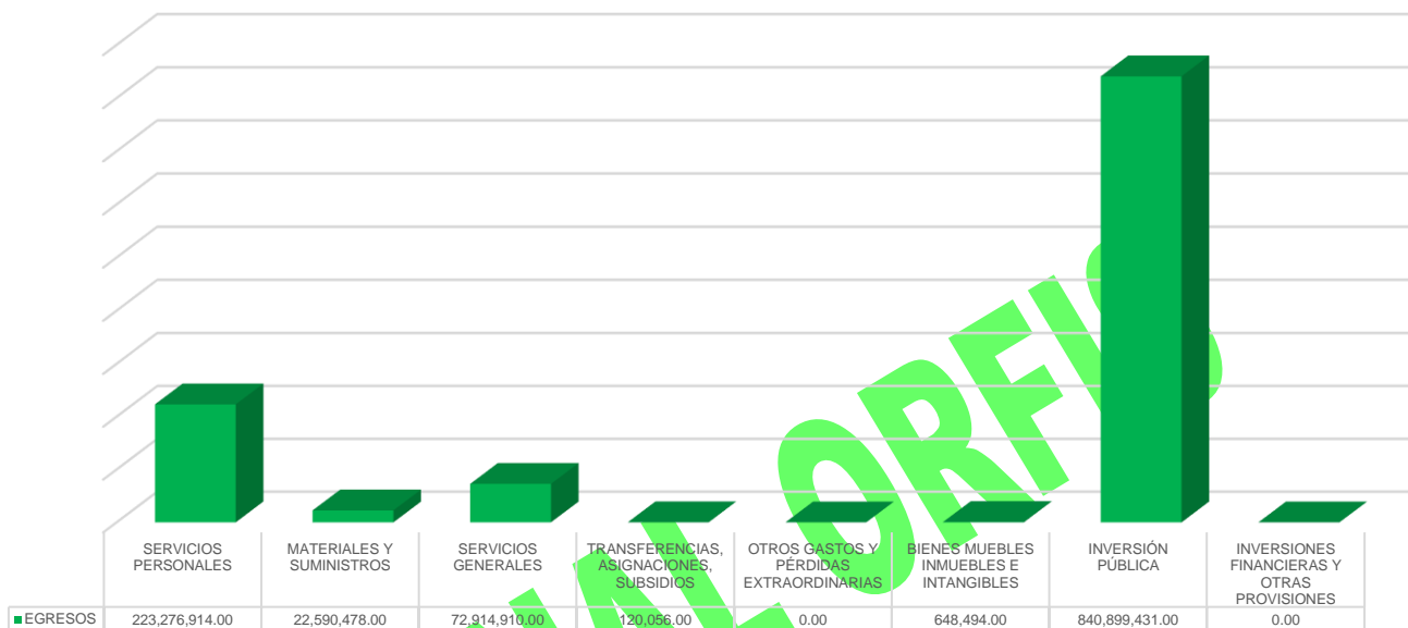
Gráfico 2. Egresos